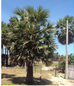
Rig på palmyrah træ i området