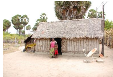
Håndlavede produkter i hjemmet. Fleste familier lever i små hytter.