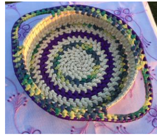
Behandling, farvelægning, mønster, produkt design osv.